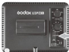
Индикатор заряда батарей